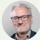
Bruno PIRIOU Maire de Corbeil-Essonnes (91)