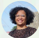
Lucie ETONNO Conseillère régionale Les Écologistes des Pays de la Loire