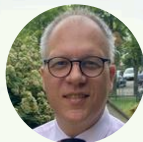
Grégory BLANC Sénateur du Maine-et-Loire Ensemble Sur Nos Territoires