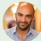
Arash SAEIDI Député européen LFI et conseiller régional des Pays de la Loire