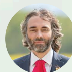
Cédric VILLANI* Président de la Fondation de l'Écologie Politique