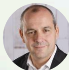
Laurent BERGER* Ancien secrétaire général de la CFDT