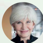
Laurence TUBIANA* Directrice de la Fondation européenne pour le climat